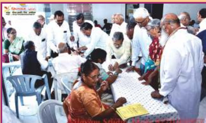
Reception at Open Session held at Hotel Indraprastha Akola on 12.10.2023