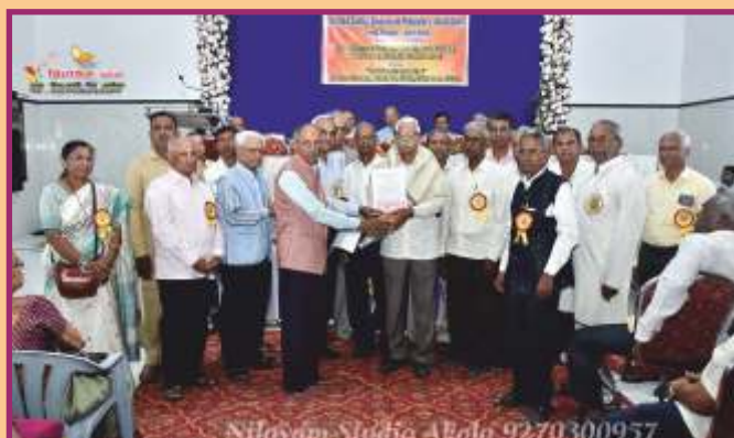
Best Branch Award was presented to Akola Branch at Open session held at Akola