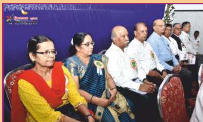
CHQ Members at Second line at dias at the Open Session held at Akola on 13.10.2023