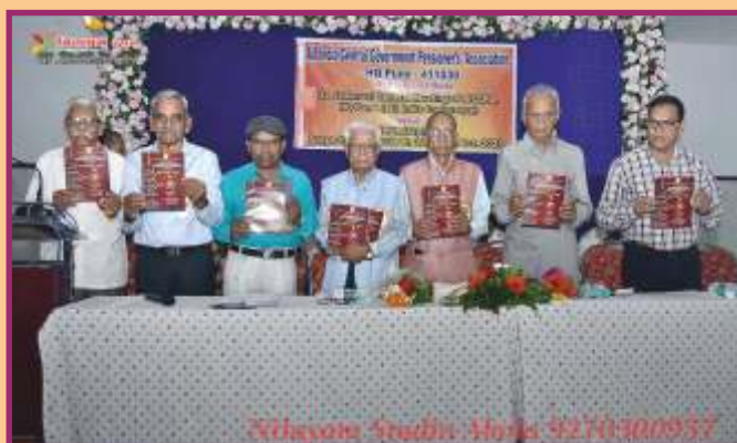
Colorful souvenir was released at Open session held at Akola on 13.10.2023