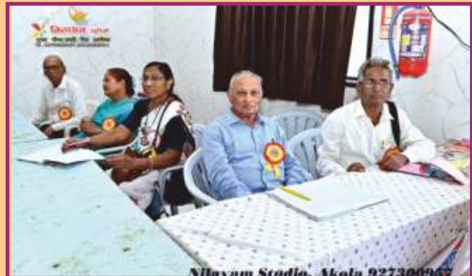
Reception at AGM held at Hotel Indraprastha Akola on 12.10.2023