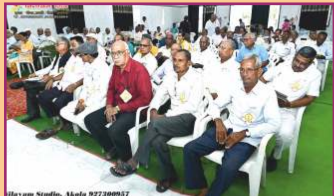
View of Audience at AGM held on 12.10.2023