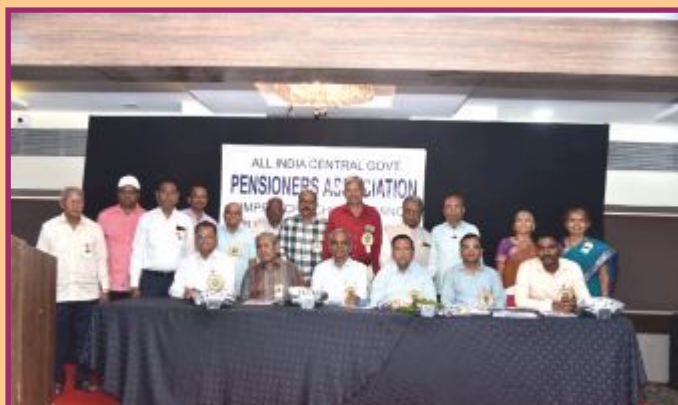
Working Committee members elected at the AGM Chinchwad held on 05.12.2023