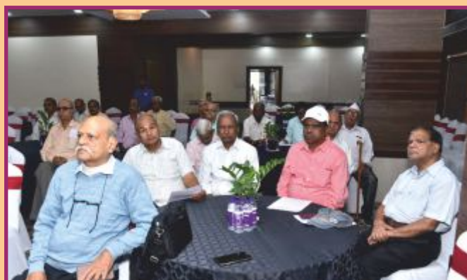
View of Audience at AGM Chinchwad held on 05.12.2023