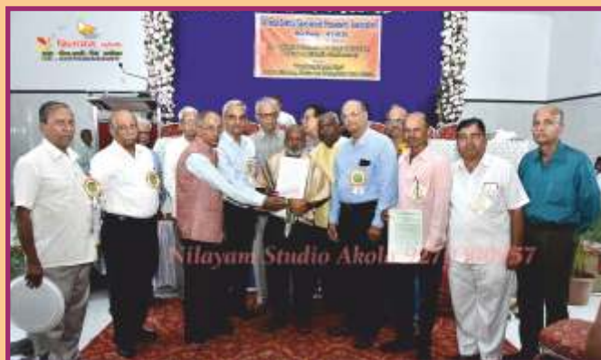
Best Branch Award was presented to Kolhapur Branch.