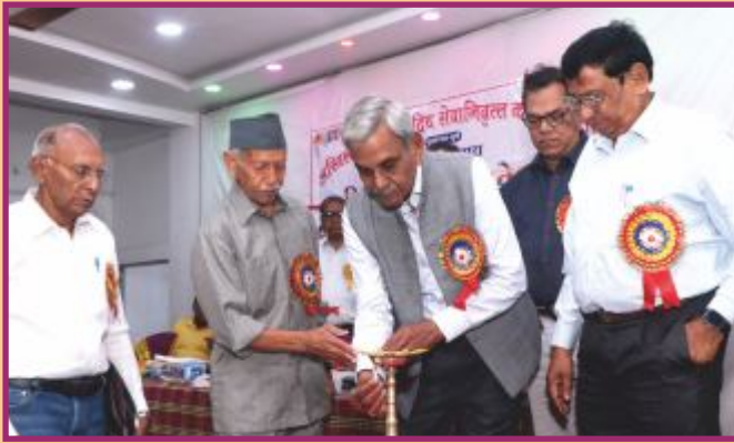
Lighting the lamp at the AGM Bhandara held on 04.11.2023