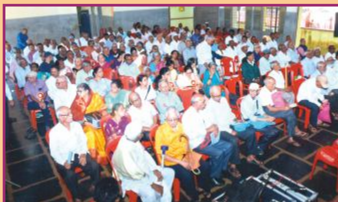
View of Mass gathering at AGM Belagavi held on 12.12.2023