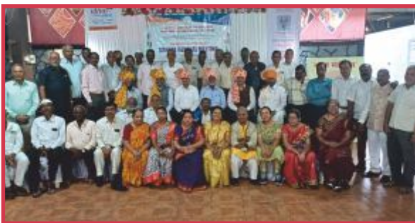
Members lined up with GS & Working Committee at Ahmednagar held on 19.12.2023