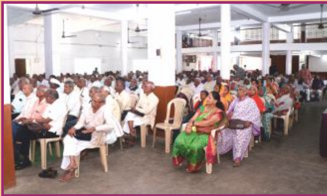
View of Audience at AGM Bhandara held on 04.11.2023